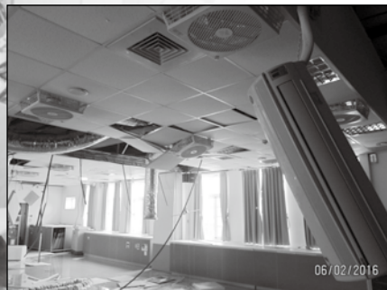
冷氣機掉落管線損壞