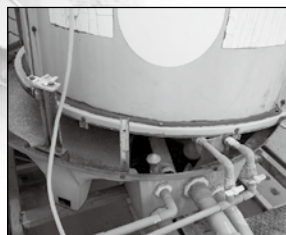
冷氣卻水塔基座傾斜