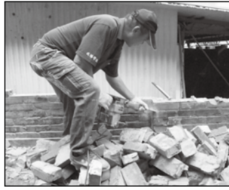
打除倒塌破損磚牆