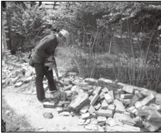
打除倒塌破損磚牆