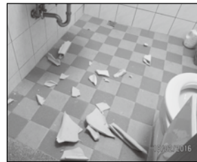
馬桶水箱蓋掉落破裂